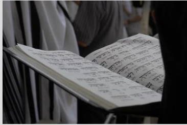
Beten im Judentum

Juden, dabei tragen die Männer Kippa (Käppchen), Tallith (Gebetsumhang) und werktags Tefillin (Gebetsriemen mit Kästchen).