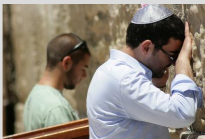
Beten im Judentum