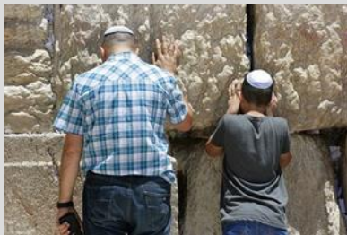
Beten im Judentum

Vielen Juden ist das Beten sehr wichtig. Es ist für sie ein Gespräch mit Gott. Sie nennen es auch „Dienst des Herzens“.