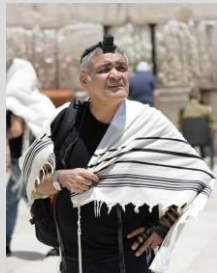
Beten im Judentum

Besonderer Ort für das Beten ist die Klagemauer. Sie steht in Jerusalem. Hier stecken die Juden auch kleine Zettel in die Mauerritzen, auf denen Gebete stehen.